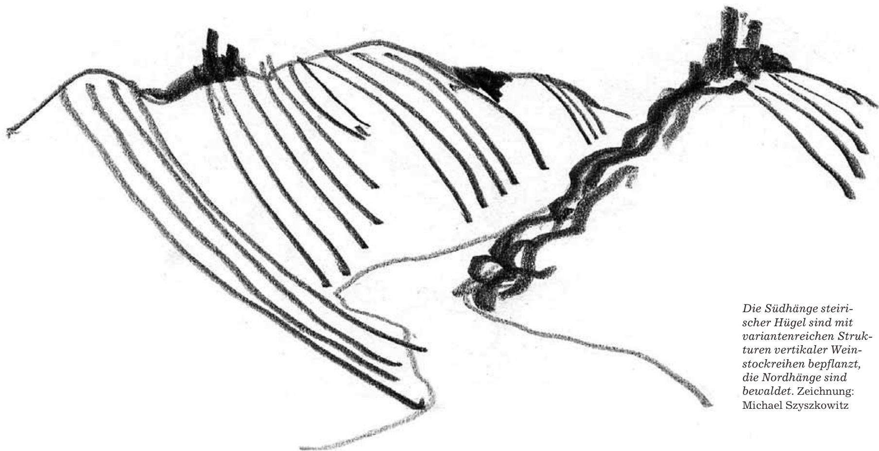
Die Südhänge steirischer Hügel sind mit variantenreichen Strukturen vertikaler Weinstockreihen bepflanzt, die Nordhänge sind bewaldet. Zeichnung: Michael Szyszkowitz